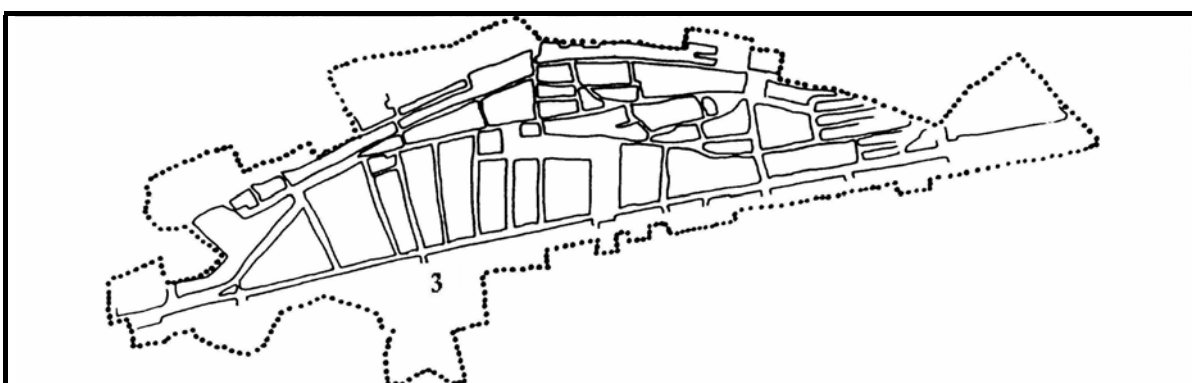
Estructura urbana de Benissa. ( Segle XIX i principis del XX )